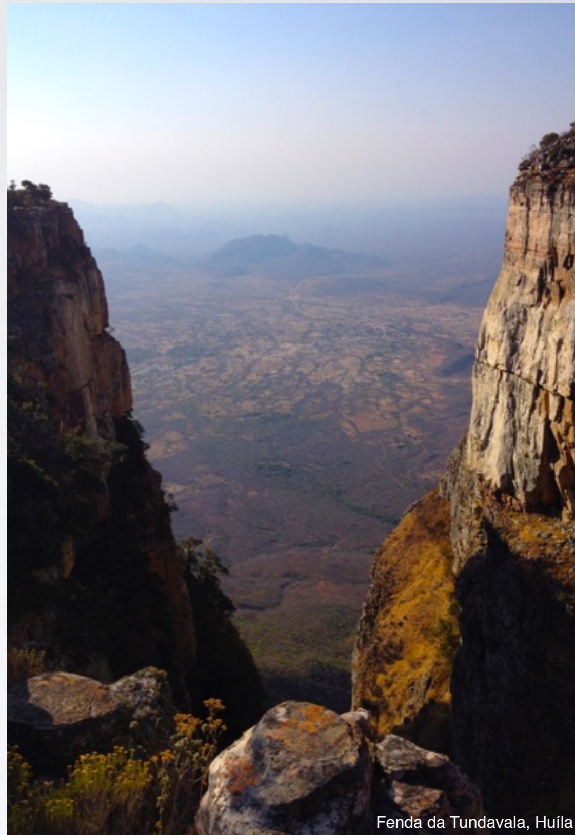
Fenda da Tundavala, Huíla